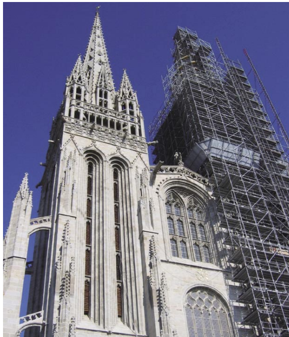
取材時は丁度修繕中だったが、それでも美しい、大聖堂にそびえる尖塔