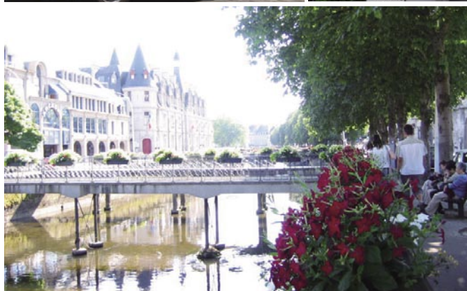
カンペール焼きをイメージした可愛い観光用トレンで、街を一巡りするの楽しい。1人5ユーロ(上左)街中の標識は、フランス語とブルトン語の両方で表記されている(上右)川沿いの景色が特に美しいカンペールの街(下)