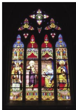
大聖堂内のどこを向いても、ステンドグラスの静かな輝きに圧倒される

Place Saint-Corentin-29000 Quimper Tel: 02 98 95 06 19 9:30～18:30(7～8月のみ公開)