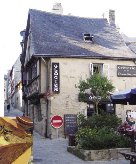
天気の良い日は、店の前のパラソルの下でガレットをいただくのも気持ちいい