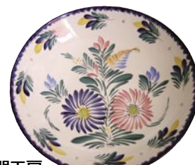
お皿だけでなく、花瓶やティーポット、ジャグなど、さまざまなアイテムが揃う

2 Bis Place au Beurre - 29000 Quimper Tel: 02 98 95 49 88 営業時間: 11:00～14:30 18:30～22:00 無休