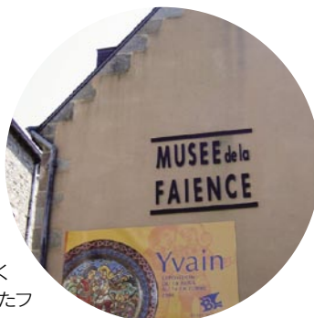
博物館は川沿いに位置している

14 rue Jean-Baptiste Bousquet - 29000 Quimper Tel: 02 98 90 12 72 開館時間: 10:00～18:00(4月中旬～10月中旬、それ以外の開館日は問い合わせを) 日曜、祭日休み 大人4ユーロ、子供(7～17歳)2.30ユーロ www.quimper-faïences.com