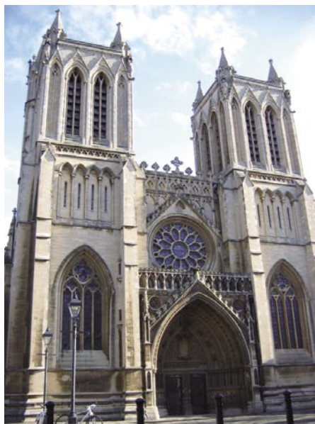
建物の隣に広がるスクエアから見る大聖堂の眺めも美しい

College Green Bristol BS1 5TJ Tel: 0117 926 4879 8:00-18:00 (月-金) 8:00 - 17:30 (土) 7:30-17:00 (日) 無料 www.bristol-cathedral.co.uk